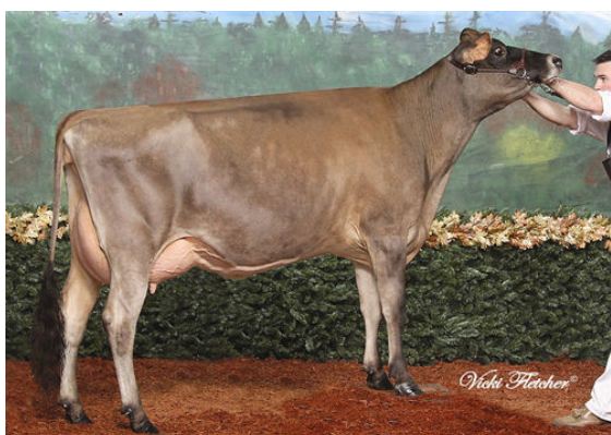
SELECT -SCOTT SALTY COCOCHANNEL THIRD DAM